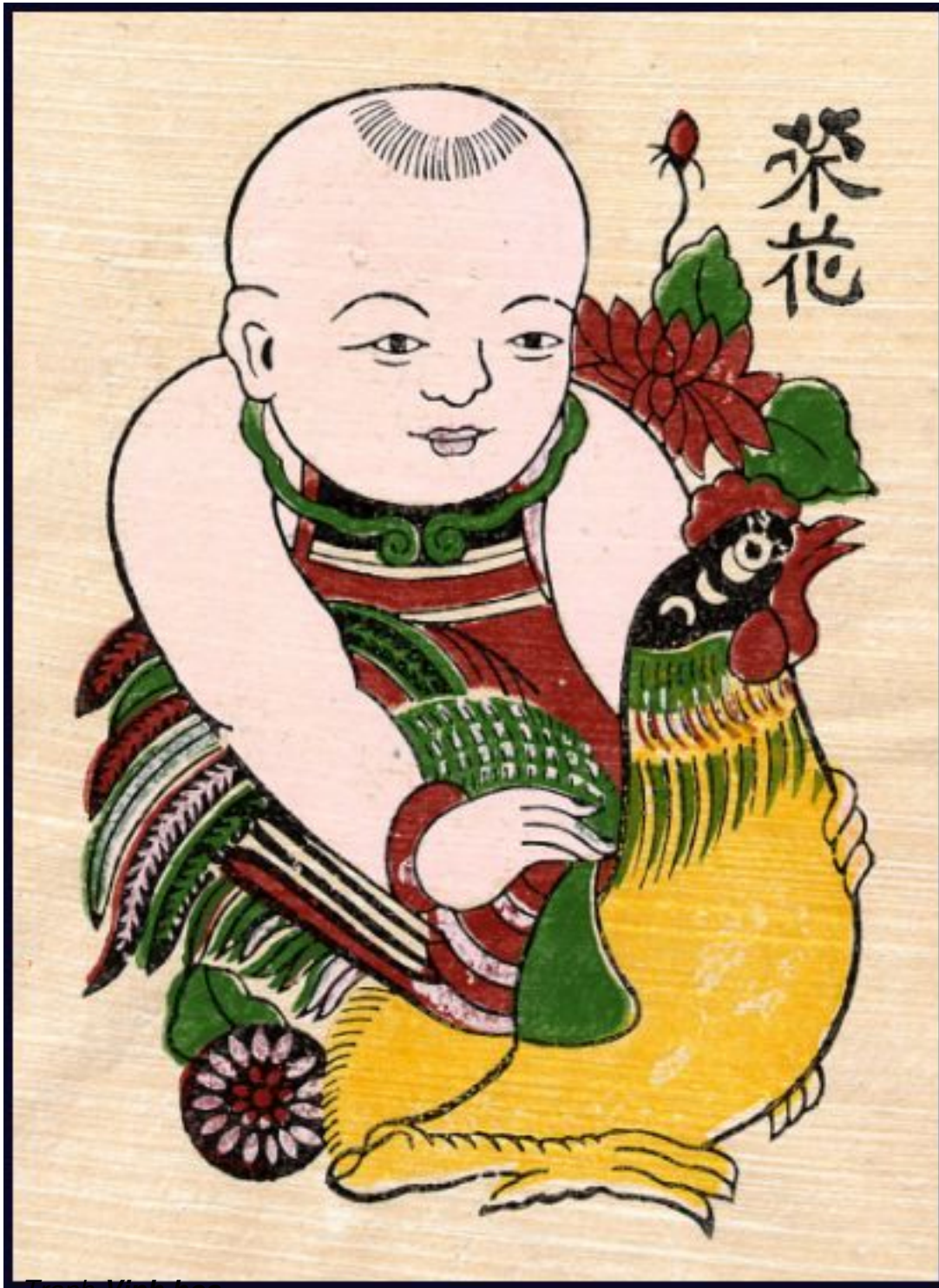
Tranh Vinh hoa